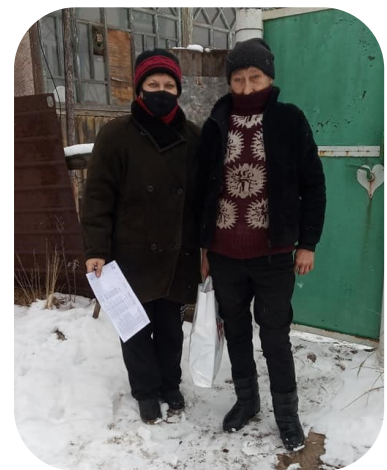
Проект за підтримки МБФ “Відродження”