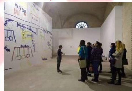
Учасники тренінгу на виставці у Мистецькому Арсеналі