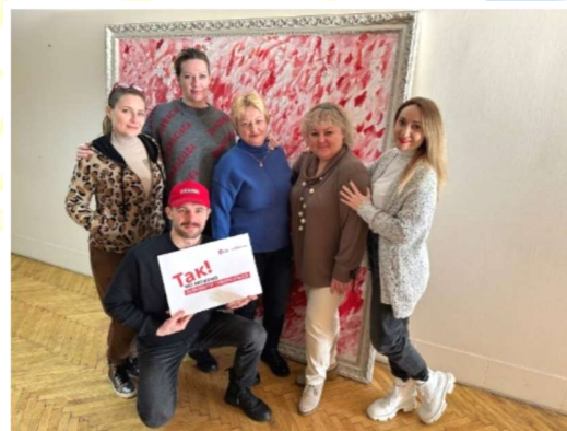
Так! Ми можемо зупинити туберкульоз!

обставинах», який реалізує з 2018 року. Та розширювали його географію.