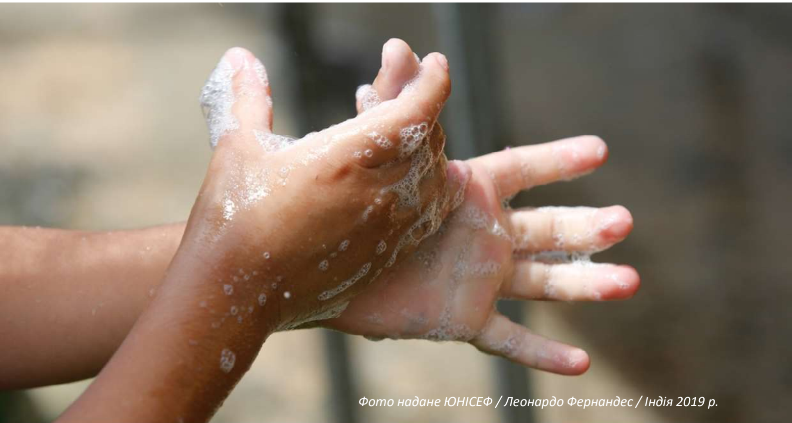
Фото надане ЮНІСЕФ / Леонардо Фернандес / Індія 2019 р.