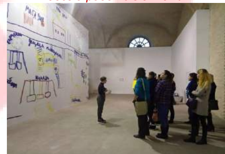
Учасники тренінгу на виставці у Мистецькому Арсеналі